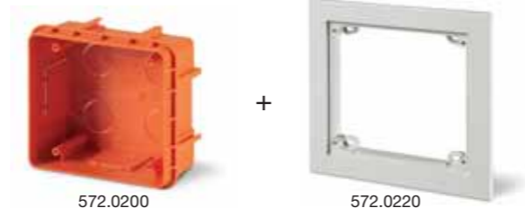
572.0200 + 572.0220 IP55